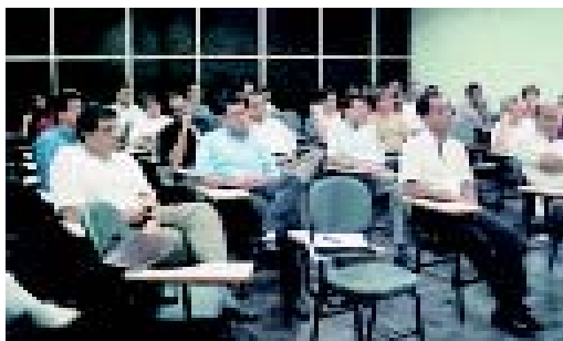
Especialistas debatem novos parâmetros do TEV

Os resultados obtidos das discussões em nível na-