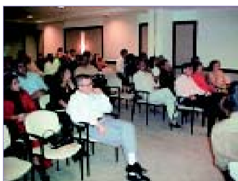
Em 12 de julho, no Confort Suites Flamboyant, a platéia bastante atenta à palestra sobre Tratamento de Lesões de Pele...

A SBACV-GO promoverá em setembro (data, horário e local serão definidos e comunicados com antecedência) uma reunião para discutir casos clínicos. Os especialistas que tiverem dúvidas devem trazê-las para o debate. Quem não as tiver deve ainda assim comparecer, a fim de colaborar com a reunião, participando com sua opinião. Compareça!