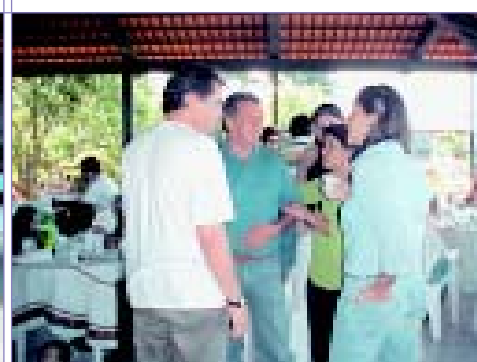
...enquanto colegas aproveitam a ocasião para colocar o papo em dia