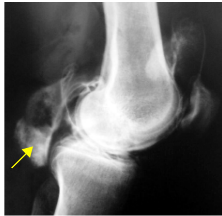
Cisto de Baker Exame: Pneumoartrografia

O tratamento na criança é conservador, normalmente com regressão espontânea em um ou dois anos. O tratamento cirúrgico está indicado na suspeita de patologia maligna ou em casos de compres-